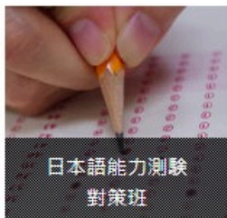
日本語能力測驗 對策班